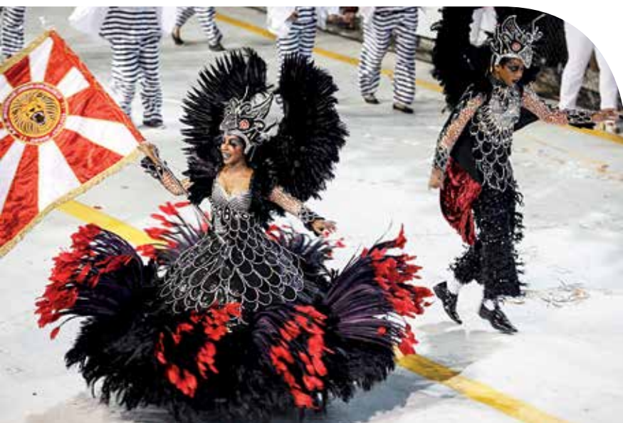
Em meio a crise econômica, o reaproveitamento de materiais é a saída para fazer carros e fantasias criativas

Por isso, o dirigente acredita que o investimento no Carnaval traz retorno para a sociedade, por empregar pessoas, gerar renda, impostos e atrair turistas. “No último Carnaval tínhamos quase 1,8 mil pessoas trabalhando de forma remunerada nos barracões.” Isso, sem contar, segundo ele, com a mão de obra indireta e com a especialização desses trabalhadores, que poderiam se qualificar mais para esse mercado, como já acontece no >>